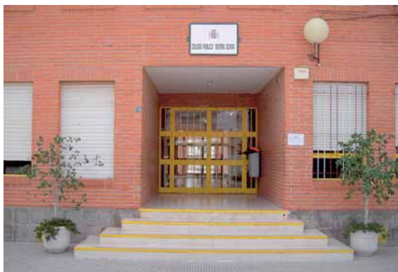
Este es nuestro cole.