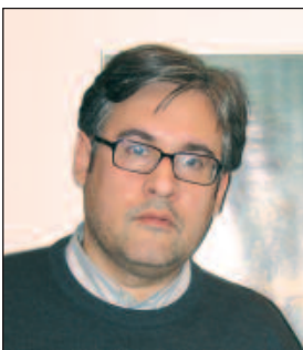
JUAN MANUEL DE PRADA Escritor

Pronunció una importante conferencia sobre "Educación y libertad" en los Diálogos sobre Educación de COFAPA.