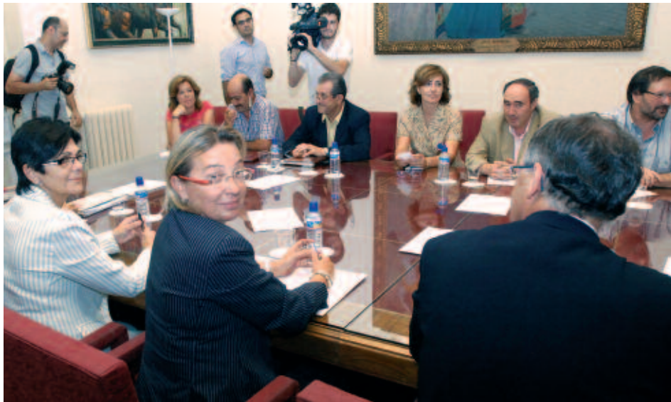
Eva Almunia, secretaria de Estado de Educación informó sobre la gripe A a los representantes sindicales el pasado 2 de septiembre.