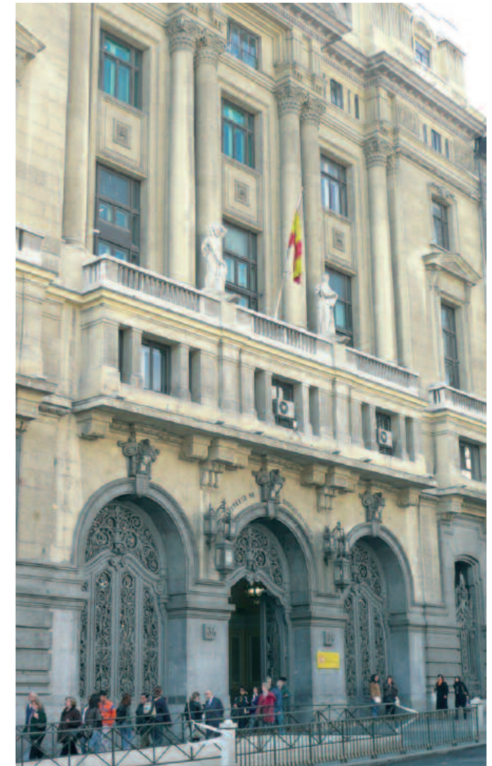
tema del Estatuto Docente está a la espera de calendario.