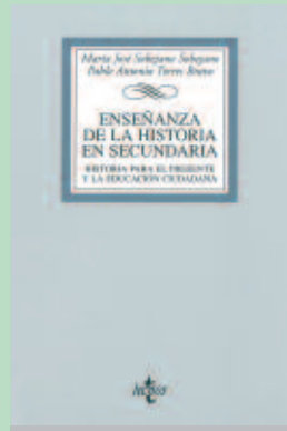
Título: ENSEÑANZA DE LA HISTORIA EN SECUNDARIA Autora: María José Soberano y Pablo Antonio Torres Bravo Editorial: Tecnos

Un retrato de las dudas y debilidades de los padres de hoy, a partir de la recopilación de testimonios y anécdotas reales cargadas de ironía y sentido del humor. El libro ofrece pistas para caminar por el complejo terreno de la educación, "que no recetas, porque no existen en esto de criar a los hijos". Y es que Papás blandiblup no es una guía educativa, ni un libro de autoayuda. La autora invita a hacer lo que llama "pedagogía de la paternidad".