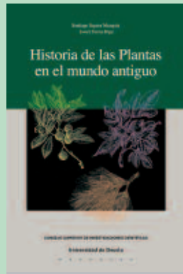
Título: HISTORIA DE LAS PLANTAS EN EL MUNDO ANTIGUO Autores: Santiago Segura Munguía y Javier Torres Ripa EDITORIAL: Universidad de Deusto-Consejo Superior de Investigaciones Científicas

Desde su experiencia como profesor de Historia, el autor relata la tarea de los liberales españoles en un siglo en el que se construyeron las bases de la España actual. El libro anima a conocer mejor el avance en la difusión de la educación, la cultura y la democracia, que proviene de la herencia de los sistemas liberales decimonónicos.