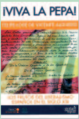
Título: VIVA LA PEPA. LOS FRUTOS DEL LIBERALISMO ESPAÑOL EN EL SIGLO XIX Autor: Felipe José de Vicente Algueró Editorial: Gota a gota

El libro presenta un enfoque de la Historia próximo a las realidades de los alumnos, rigurosa en los hechos y abierta a las realidades mejorables de nuestro tiempo, aportando una nueva respuesta a la antigua pregunta: ¿Para qué sirve la Historia?